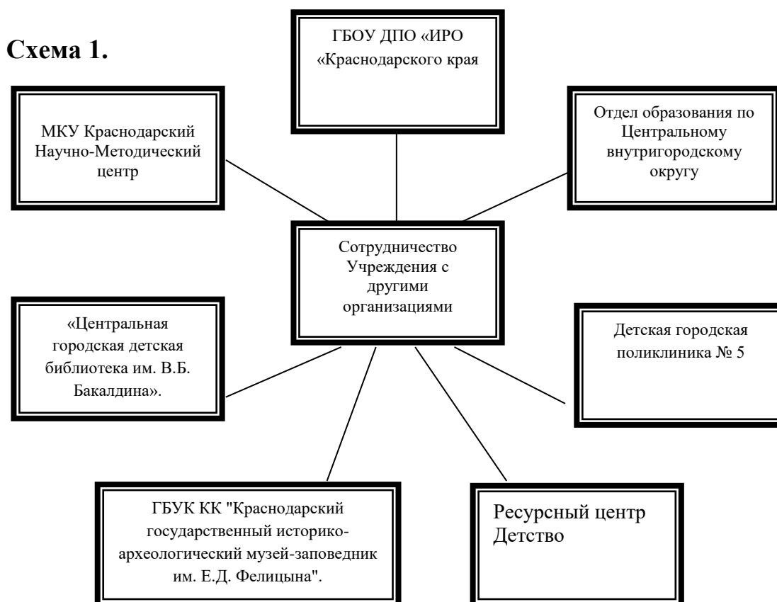
Схема 1. представляет все связи взаимодействия Учреждения с другими учреждениями социокультурной сферы станицы, которые помогают в обогащении образовательного процесса и расширении образовательного пространства.